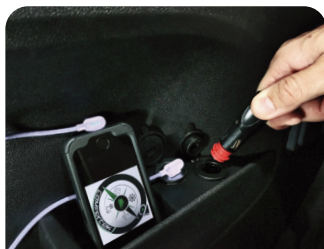
BATERÍA AUXILIAR BATERIA AUXILIARRA