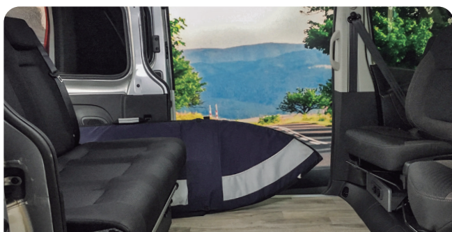
ASIENTO CON HUECO LATERAL ESERLEKUA ALBOKO HUTSUNEAREKIN