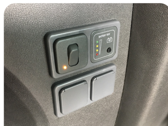
220V INVERSORES Y CARGADORES 220V INBERTSOREAK ETA KARGAGAILUAK