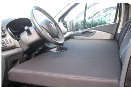
CAMA PARA CABINA KABINARAKO OHEA