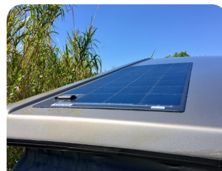
PLACA SOLAR EGUZKI PLAKA