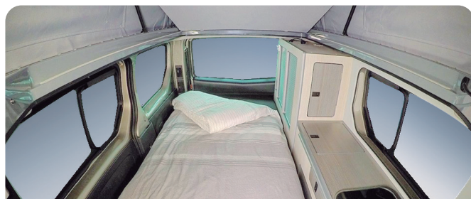
ASIENTO-CAMA CON RAÍLES ESERLEKU-OHEA ERRAILEKIN