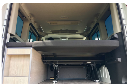
ARCÓN LATERAL ALBOKO KUTXA