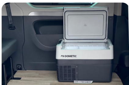
NEVERA PORTÁTIL HOZKAILU ERAMANGARRIA