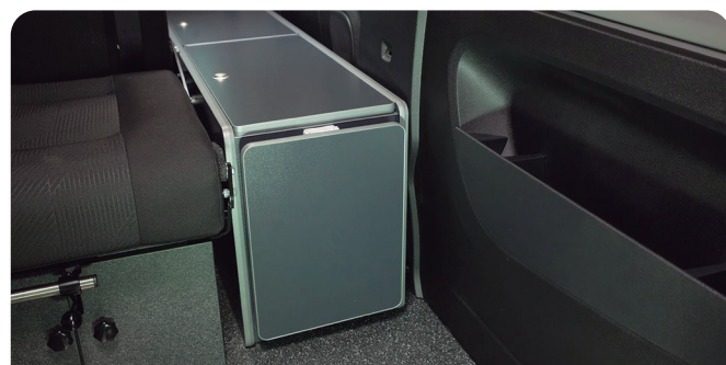
ASIENTO CON ARCÓN ESERLEKUA KUTXAREKIN