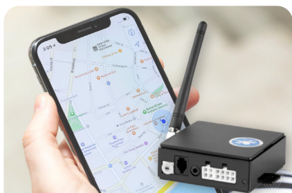
ALARMA ESPECIAL ALARMA BEREZIA