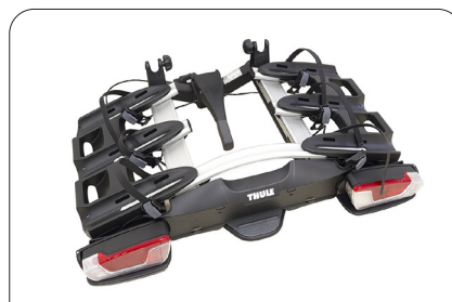
PORTABICIS BIZIKLETAK ERAMATEKOA