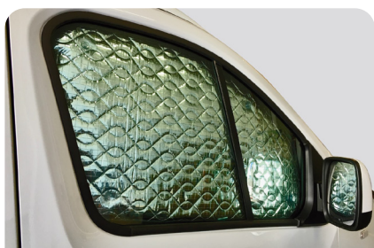
OSCURECEDORES TÉRMICOS ILUNTZAILE TERMIKOAK