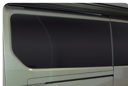
TINTADO DE LUNAS BEIRAK TINDATZEA