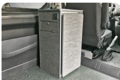
MÓDULO COMPACTO EXTRAÍBLE MODULU TRINKO ATERAGARRIA