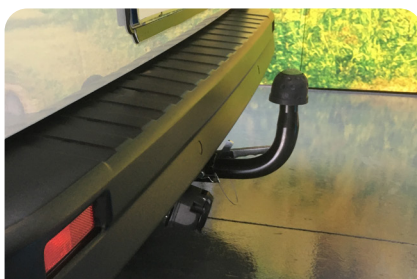
ENGANCHE DE REMOLQUE DESMONTABLE ATOIA LOTZEKO KAKO DESMUNTAGARRIA