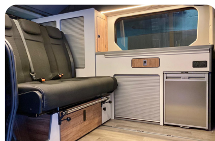
MOBILIARIO LATERAL ALBOKO ALTZARIAK